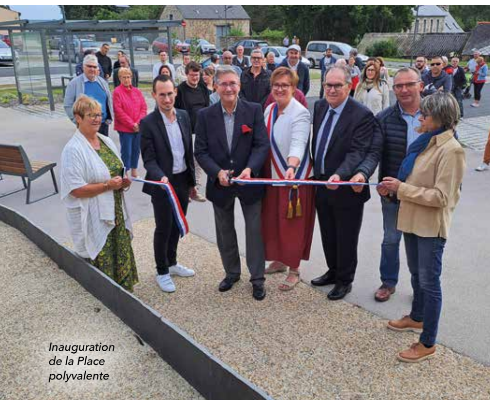
Inauguration de la Place polyvalente

Désormais, dans une logique de poursuite d'aménagement du site de la Vallée, une réflexion sera menée à moyen terme pour faire que cet écrin de verdure poursuive son développement et son attractivité dans l'intérêt de tous.