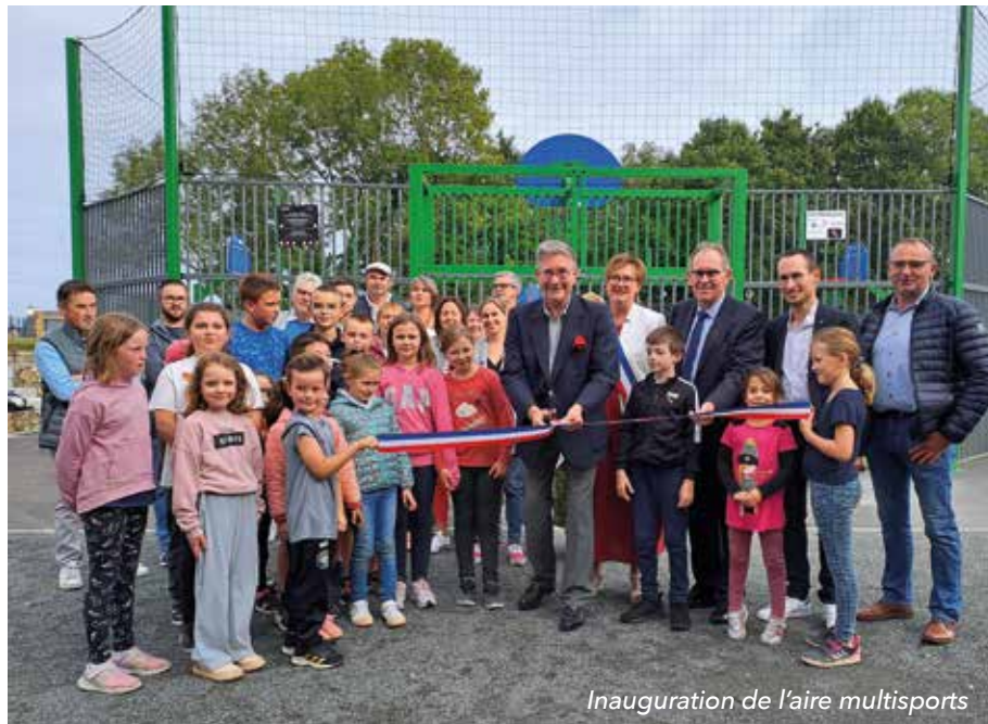
Inauguration de l'aire multisports

Cette inauguration a été aussi l'occasion de remercier les partenaires