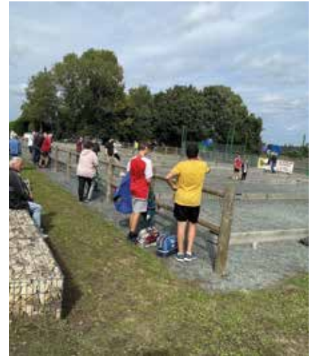
Concours de boules