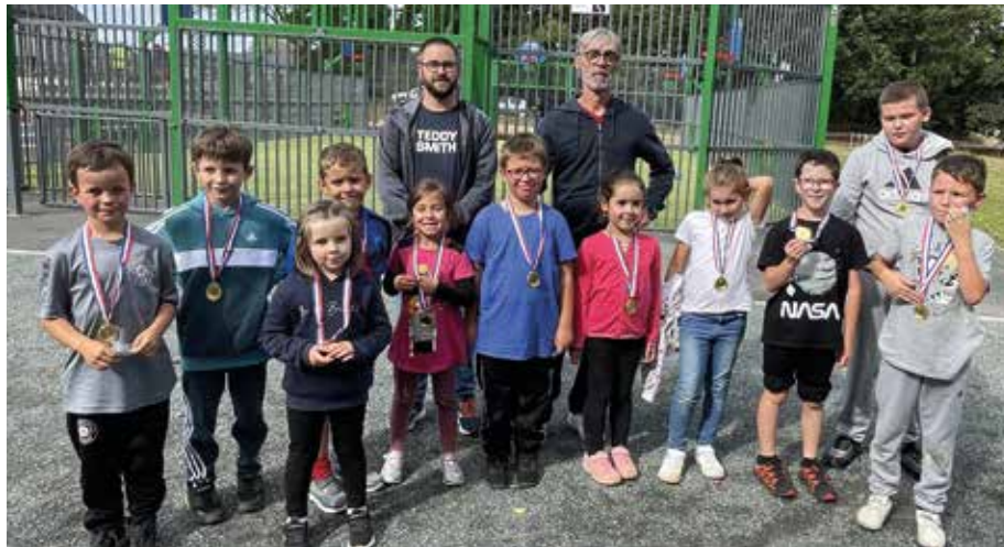
Course dans la vallée