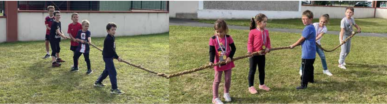
Tir à la corde