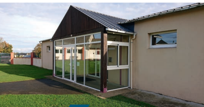
Création d'un SAS à la garderie